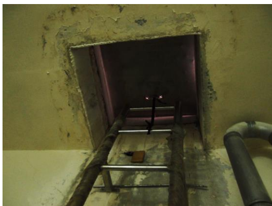
頂樓排風櫃變頻器移機室內