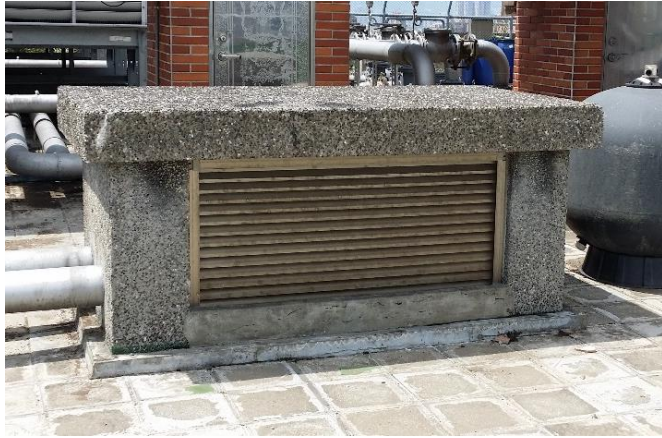
頂樓東側防護網補做改良